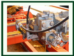
Detailansicht der Sprühanlage

Beim Einsatz einer Blockbandsäge*, ohne Verwendung von BIOM - OIL Schneideöl, mit einem Rollendurchmesser von 1600 mm ergibt sich eine Blattdicke von ca. 1,6 mm und einem Überstand von je 0,8 mm, eine Schnittfuge von 3,2 mm.